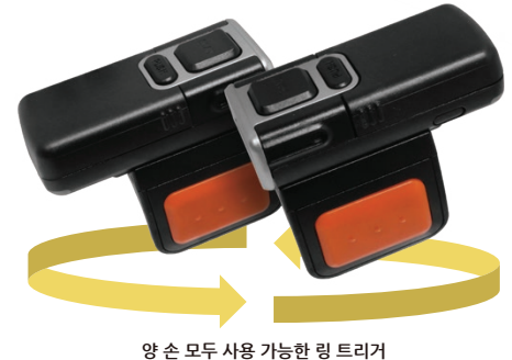
양 손 모두 사용 가능한 링 트리거

관련 문의사항이 있을 시 service@pointmobile.co.kr 을 통해 전달해 주시기 바랍니다.