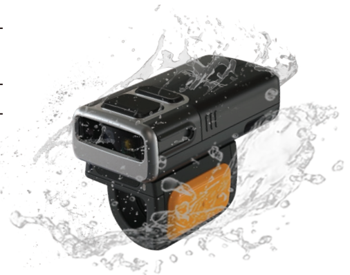
IP65 방수/방진 등급